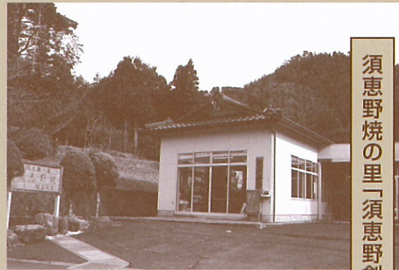
須恵野焼の里「須恵野創作館」