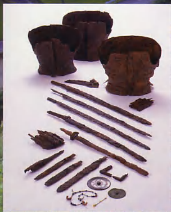
向山1号墳主要出土品

発掘調査関係者と韓国の考古学者を招き、その成果の実態を語るシンポジウムを開催します。