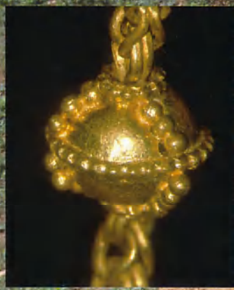
向山1号墳金製垂飾付耳飾電子顕微鏡写真