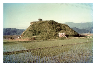
▲在りし日の丸山塚古墳

この、かつて直径50mの北陸地方最大の円墳は、壊された時の計測では、玄室6m、廊下11mで、石室は、奈良の明日香村の石舞台古墳に匹敵するようなものでした。