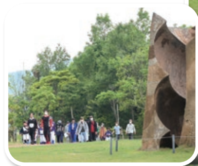
縄文ロマンパーク

若狭さとうみパークを主会場に、第31回若狭・三方五湖ツデーマーチを開催しました。今年「リニューアル」として、同会場で「マーチとマルシェ ～里・音・市場～」が開かれ、飲食物の販売、音楽・ダンスやお笑いのステージがあり、ゴールした参加者らで賑わっていました。2日間で4,117人が参加し、新緑香る町内のウォーキングを楽しみました。