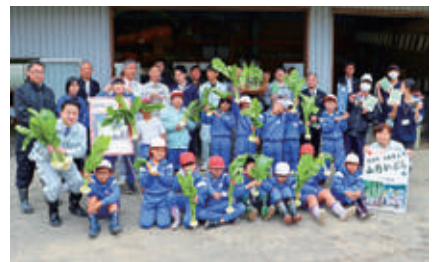
収穫祭 (地元小学生らと)