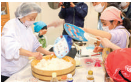
親子ちらしずし教室 (パレア若狭)