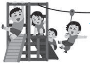
子どもたちと一緒に目のリフレッシュタイムを!

また、近年発表された慶応大学の研究によれば、屋外の自然光に含まれる「バイオレット光」が、近視の進行抑制に効果があると報告されています。