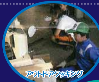
アウトドアクッキング