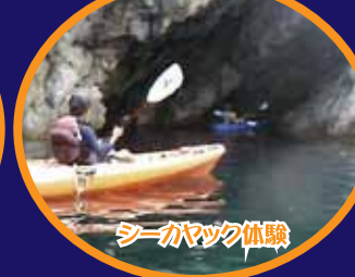
シーカヤック体験