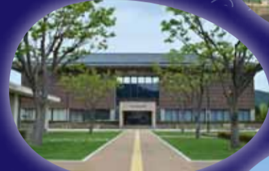
福井県立若狭歴史博物館