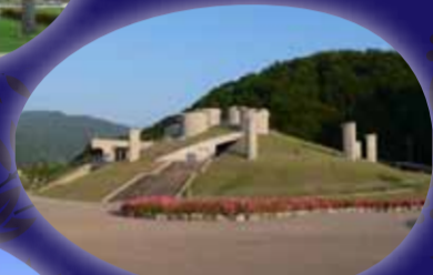
若狭三方縄文博物館