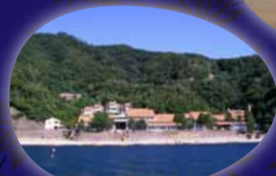
国立若狭湾青少年自然の家