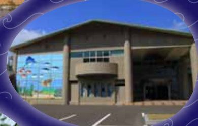
福井県海浜自然センター