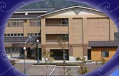
福井県立三方青年の家