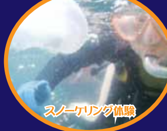
スノーケリング体験