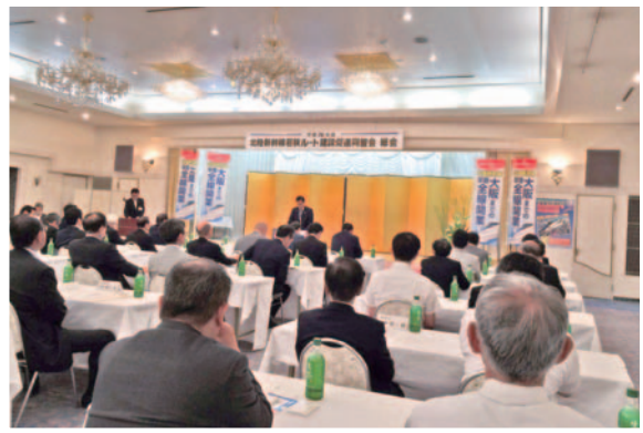
6月18日 北陸新幹線若狭ルート建設促進同盟会総会 (小浜市)