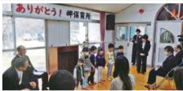
3月27日 岬保育所閉所式