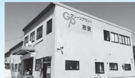
グリーンプラント若狭