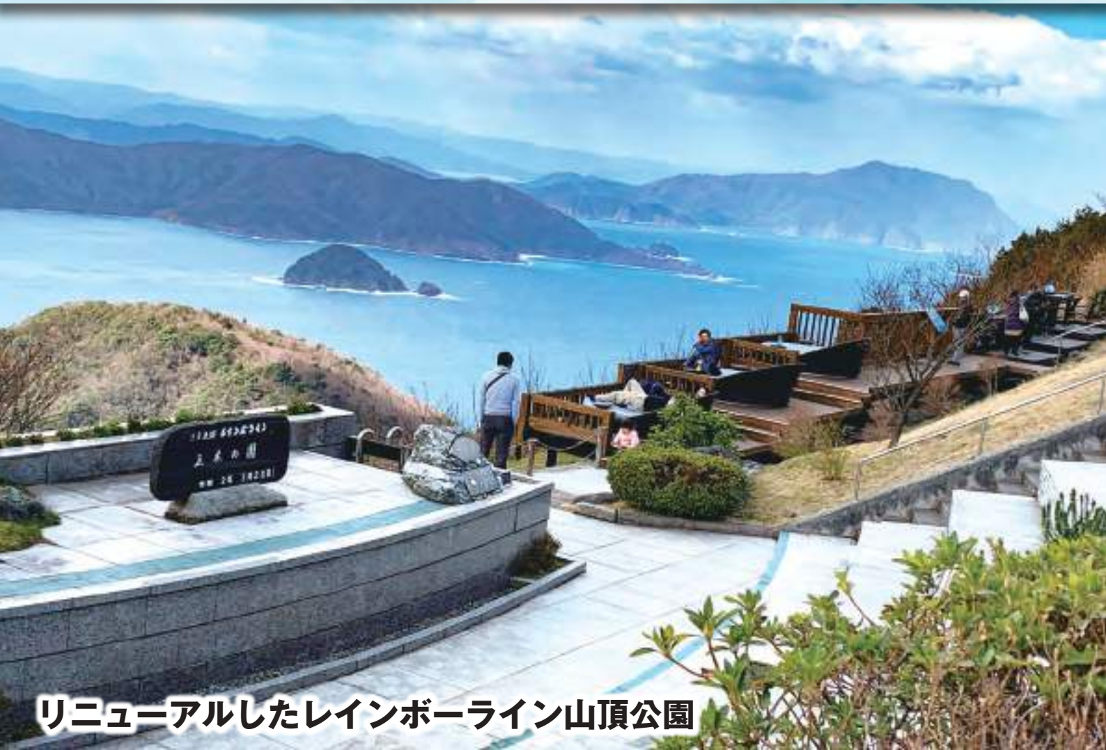
リニューアルしたレインボーライン山頂公園