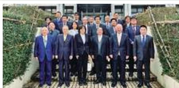
2月13日 高槻市議会表敬訪問