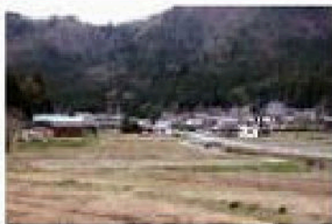
集落風景。 奥に見えるのは「若狭中核工業 団地（若狭テクノバレー）」