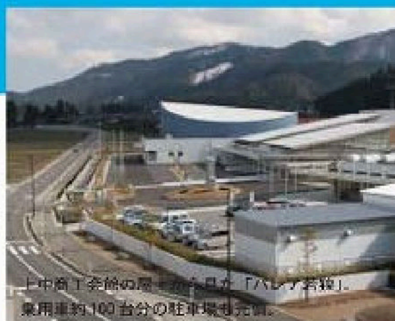
上中倉工業館の隣に今年4月、「パレア若狭」。 乗用車約100台分の駐車場も完備。