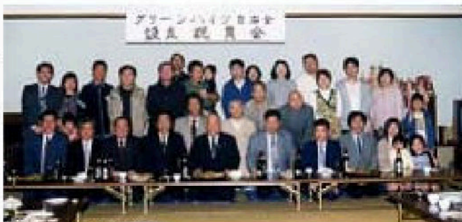
↑自治会設立祝賀会

昨年4月に発足した自治会です。グリーンハイツは若い人が多く、今後、区の歴史を作り、町の発展に寄与していくことと期待されています。それぞれの家屋が異なり住宅展示会場のように、散歩するのが楽しい町並みです。