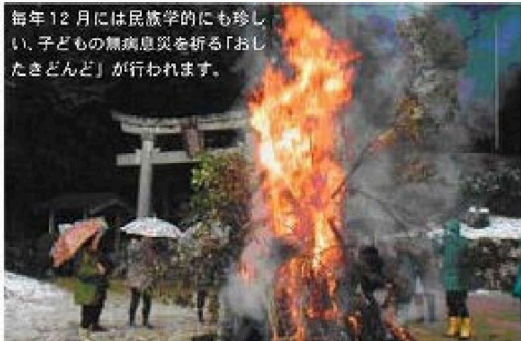
毎年12月には民族学的にも珍しい、子どもの無病息災を祈る「おしたきどんど」が行われます。

仮屋区は、八幡神社を中心とした歴史の古い集落です。その昔、源頼光が仮の陣屋を置いて滞在したといわれ、その後陣を取り除き「仮屋」という集落が生まれたとされています。八幡神社境内には、町指定の天然記念物「山もみじ」がそびえています。