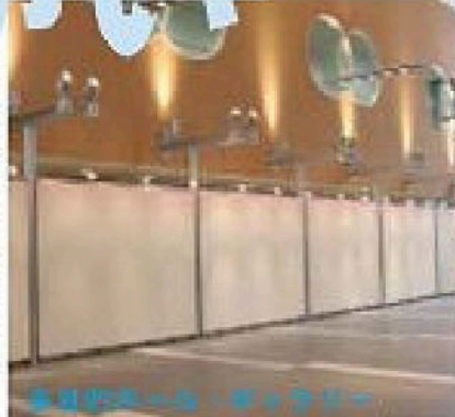
多目的ホール・ギャラリー

【多目的ホール・ギャラリー】雑誌閲覧や絵画などの展示ができ、憩いの場となりそうです。【創作スタジオ】陶芸教室などを行う部屋。電気窯やろくろなども備えています。【音楽スタジオ】カフオケや楽器の練習ができる部屋です。【キッチンスタジオ】料理教室などを行います。【和室】茶室や書道などにも利用できます。