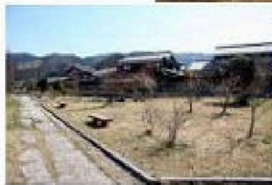
←集落内にある公園では、のどかなひとときを過ごせます

河内川ダムの建設により、平成8年に河内区から移住し、若王子区を発足させました。この若王子区は町の高台にあり、遠くは小浜方面、鳥羽・瓜生方面が一望でき、大空環境に恵まれたところです。近年は周辺にたくさんの分譲宅地ができにぎやかになっています。