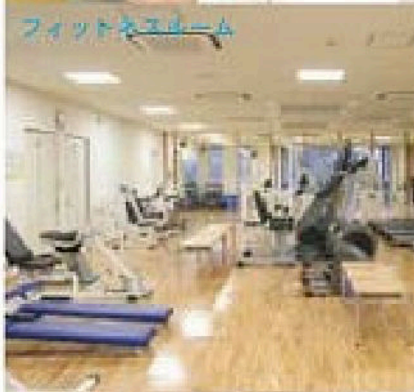
キッチンスタジオ

【社会福祉協議会事務局】社会福祉協議会上中支所が置かれています。【デイサービスセンター】介護保険の認定者が利用できます。【生活支援ハウス】1人暮らしなどのお年寄りが入所できます。