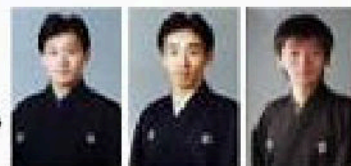
茂山正邦 茂山 茂 茂山逸平