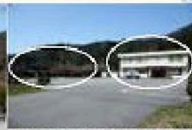
↑野木公民館と先日完成した就農支援ハウス