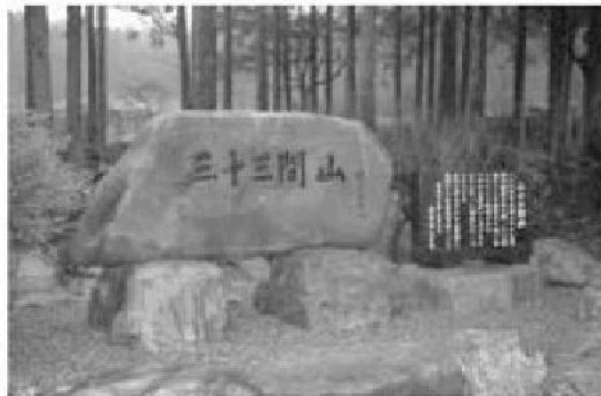
「三十三間山」の銘と「いわれ」が記された石碑