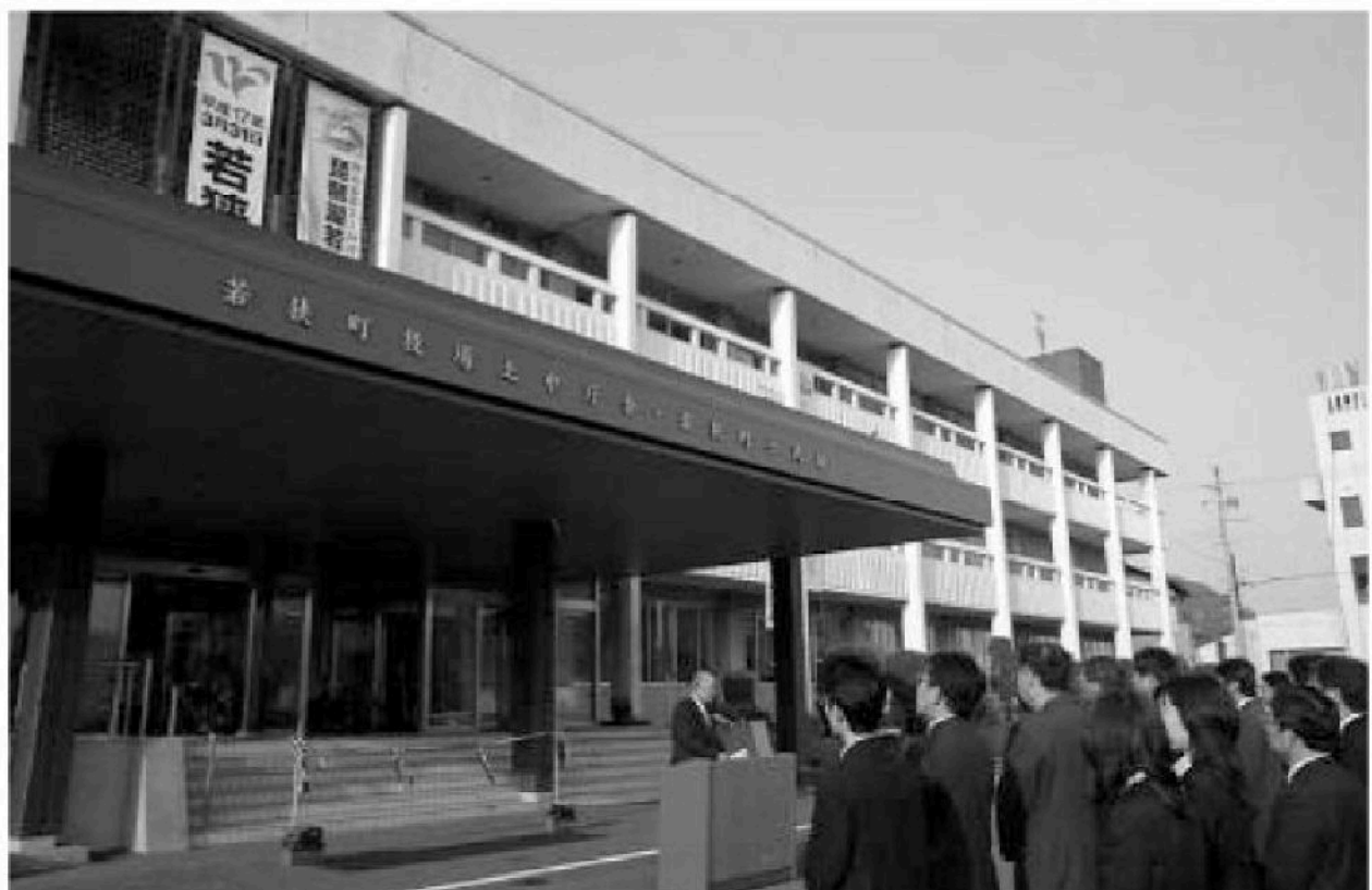
上中庁舎前で行われた開庁式

若狭町のまちづくり基本理念である「輝きと優しさに出会えるまち」の実現に向け、住民と行政が一体となって行政運営が円滑に推進できますよう皆さまのご理解とご協力をお願い申し上げます。