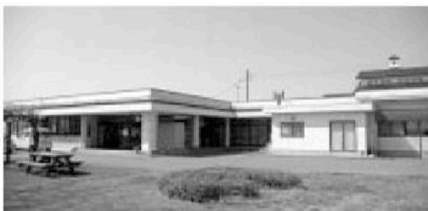
↑三方保健センター