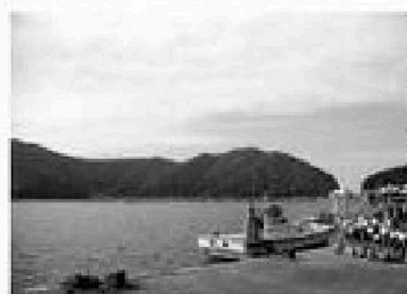
●DATA 水深38メートル・面積0.92平方キロ・周田3.8キロ。海と直結していて、漁村風景が広がっています。

日向湖は、日本海と直結している海水の湖です。海から入り組んでいるため、波が穏やかで、たくさん釣船が停泊する天然の港になっています。また、アジシジミやアサギイカなど、ほかの湖では見られない魚種が捕れ、ハマエビなどの養殖場としても利用されています。ラムサール条約に登録されることになり、古い網や漁船の処置など、気を付けなければなりません。