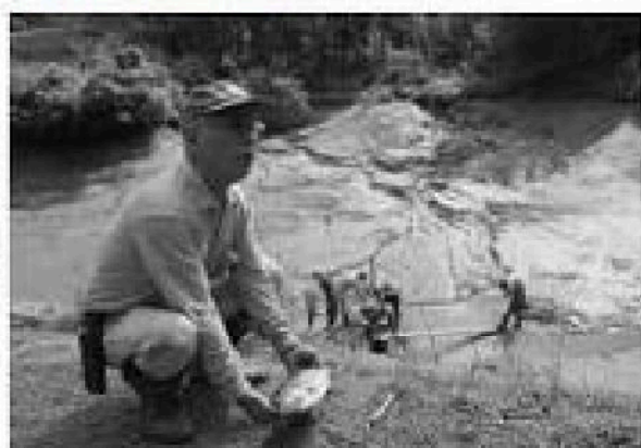
気山のため池で、観とされるブラックバスを捕獲