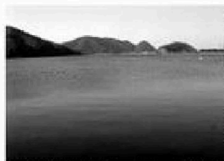
●DATA 水深3メートル・面積1.25平方キロ・周田7キロ。ポート競技の場として有名です。

久々子湖といえはシジミ漁です。久々子湖は、海水と淡水が混ざった汽水湖と呼ばれ、ヤマアジシジミが生息しています。4月から11月の方法でアジシジミで、年間5トンのシジミが採れます。美浜の朝市でも人気です。保蔵所などシジミ漁産品体験にも訪れ、大規模な採りています。現在は、シジミ漁産品体験が中心で、漁獲はシジミの収穫「びん」が中心です。