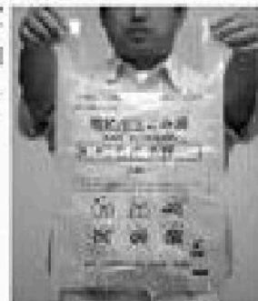
新しくなった生ごみ袋

※広報紙に「あなた」が写っていましたら役場企画情報課にご連絡ください。写真を差し上げます。(010770-45-9110)