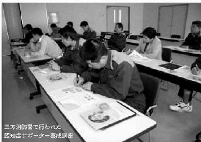
三方消防署で行われた 認知症サポーター養成講座