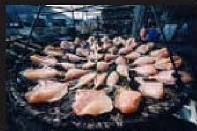
『天日干し』 広田和夫 (山口県)