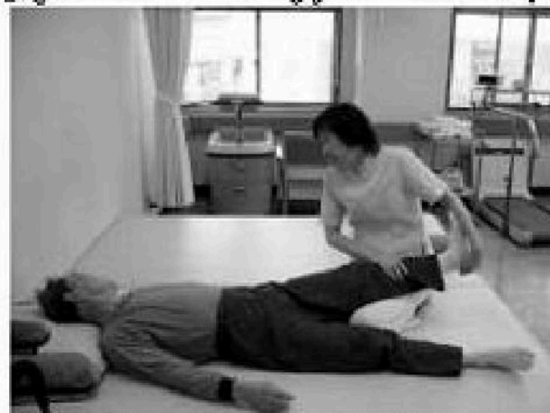
理学療法士などがリハビリ治療を行います

腰痛、関節痛、神経痛などの病気、外傷後や事故後の後遺障害、また脳梗塞などに対して運動療法や物理療法を組み合わせ治療を行います。リハビリテーション外来は、平日の午後からです（午前中は整形外科の外来）。お気軽にお越しください。