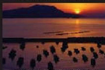
『落日の漁港』 平野 勉 (美浜町)