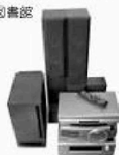
購入した視聴覚備品