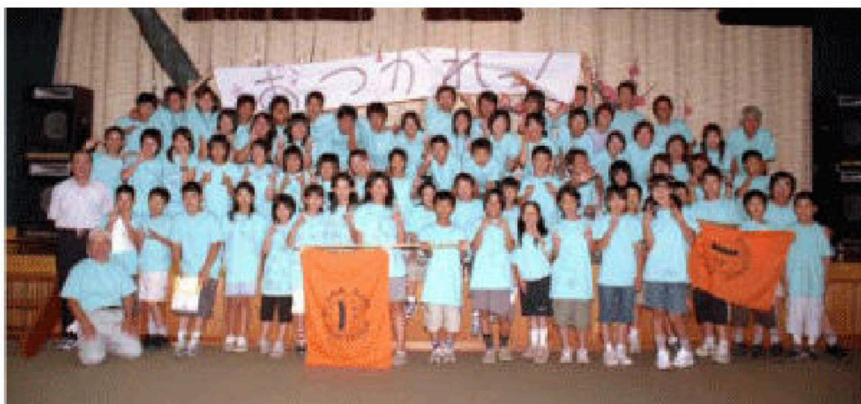
約 60 キロを踏破した小学生と町ジュニアリーダーズクラブのメンバーら