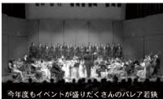
今年度もイベントが盛りだくさんのバレー若狭