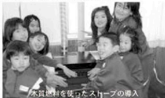
木質燃料を使ったストーブの導入

◎環境再生への取り組みに————— 1,809万円 ……19年度は小学校などの公共施設にペレットストーブを配置するほか、ストーブの燃料となる木質ペレット製造機を導入します。 ◎農村環境の保全に取り組むための助成に—1,536万円 ……農地や農業用水などの資源や環境を保全するため、農業者だけでなく地域住民が一丸となって取り組む集落などを支援します。