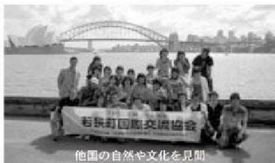
他国の自然や文化を見聞

◎国際交流事業に————— 543万円 ……国際化時代に活躍できる人材の育成を図るため、町内に住む中学3年生から高校3年生を対象にオーストラリア派遣研修を行います。他国の自然や文化を見聞し、他国での生活を通して現地の人々との交流を深める機会を提供。参加費用の約4割を町が補助します。