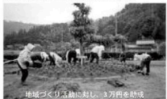
地域づくり活動に対し、3万円を助成