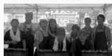
お待ちしております