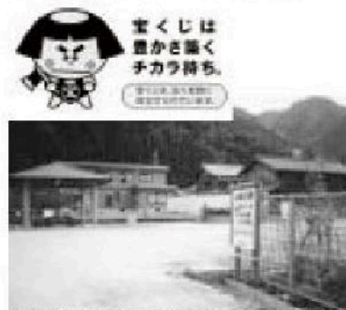
向笠区に整備したコミュニティ広場