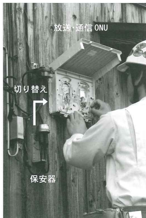
保安器からONUへの切替工事(上中地域)

現在、新しい有線電話を再整備するにあたり、新しい有線電話帳の作成を予定しています。そのため、屋内配線工事が完了した際に、屋内配線業者が有線電話帳への記載に関する事項を確認させていただきますので、ご協力をお願いします。