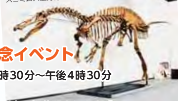
スココムス全身骨格標本