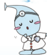
水道キャラクター Dr.すいどー