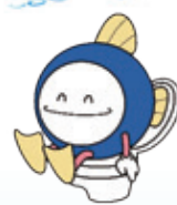
下水道キャラクター スィスイ